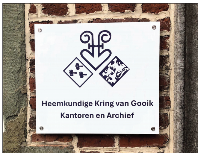
Een duidelijk opschrift aan de ingang van de Cam: hier zijn onze lokalen, met dank aan het gemeentebestuur. Met dank aan Johnny Van Bavegem voor de afwerking van dit bord.

Nog beneden wordt een ruimte vrijgehouden voor dubbele boeken en voor materiaal bij evenementen. Op de eerste verdieping zijn 2 lokalen voor onze stock voor-