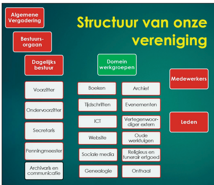
De nieuwe structuur met onze werkgroepen.

Na 40 jaar is het tijd om onze structuur binnen de kring uit te breiden naar onze actuele noden en werkzaamheden. Met de huidige structuur is het moeilijk om ondersteuning te blijven geven aan de vele activiteiten waarmee onze kring zich dagelijks bezighoudt. Daarom hebben wij op de algemene vergadering van 25 juni 2025 onze nieuwe structuur voorgesteld die unaniem werd goedgekeurd.