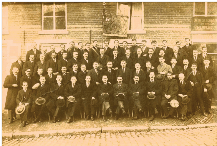
Foto van de groep oud-strijders van de Eerste Wereldoorlog.