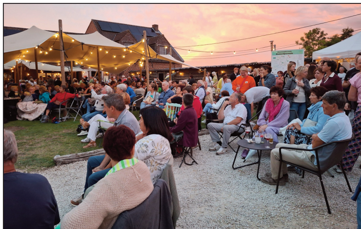
Het plein vóór Den Haas zat proppensvol, die hele laatste zondag 31 augustus 2025.

Maar dat is niet zomaar gebeurd. Heel het weekend was het enorm druk en dus ook nog enorm zwaar voor de twee zussen en hun helpers. En op zondag zelf was het geëvolueerd naar een soort ‘happening’ (een raar woord voor de situatie, natuurlijk) met honderden aanwezigen, trouwe klanten, nieuwsgierigen en sympathisanten die die laatste dag wilden meemaken.