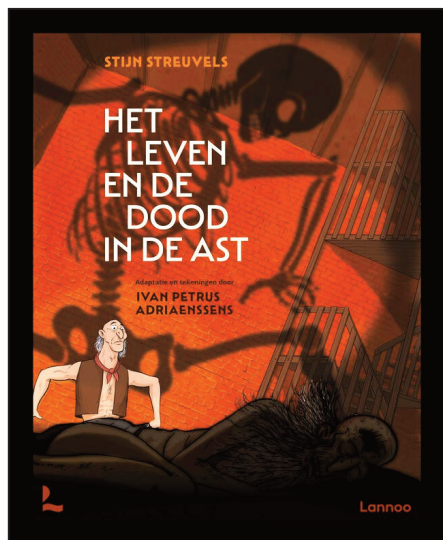
Rechts de cover van de nieuwe strip/graphic novel van Ivan Adriaenssens. Bemerkt de gelijkenis!

spiksplinternieuwe strips meebrengt en ook te koop aanbiedt, vanzelfsprekend.