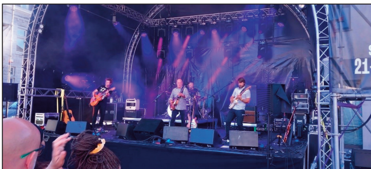
Beeld van een optreden van de Beatles-covergroep 'Abbey Road'.

De avond bestaat, zoals al geweten door de meesten, uit 2 delen. In het eerste deel komt Philip Vergote, dé Beatles-kenner van Vlaanderen, ons nog wat meer info en wetenswaardigheden vertellen over de beroemdste groep uit de Golden Sixties. Hij doet dat aan de hand van beelden, foto's en geluidsfragmenten die tamelijk speciaal en uniek zijn.