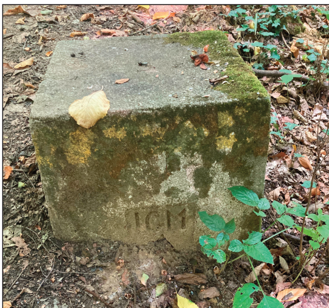
De bewuste steen op de Kesterheide.

1. We kregen een berichtje van Herman Cornelis, een lid uit Lennik: Ik wandelde onlangs naar de IJzeren Man op de Kesterheide. Aan de voet ervan vond ik deze steen met “ICM”. Weet iemand: 1. Wat die steen daar doet? 2. Wat betekent “ICM”?