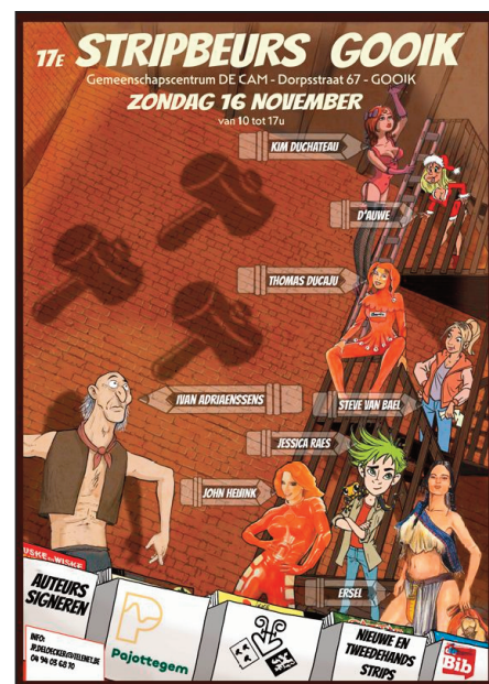
De flyer/affiche van onze 17de editie van de Gooikse stripbeurs.

Ook deze activiteit is een jaarlijks terugkerend fenomeen geworden, en maar goed ook. Er kijken heel wat stripliefhebbers/sters uit naar deze dag, zowel jong als oud: de 17e editie is dat intussen van de Gooikse stripbeurs. Naar goede gewoonte komen er een tiental standhouders langs, die strips in alle maten aanbieden: van klein naar groot, van (heel) oud naar redelijk recent. En er is natuurlijk ook Nelly, van de Aalsterse stripwinkel 'Hermelijn' die