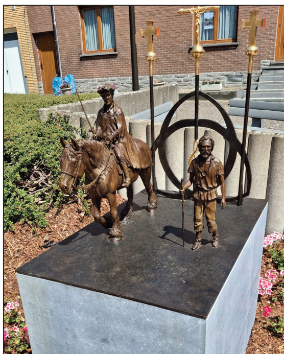
Het beeld van de Sint-Maartenprocessie, door Francis Geeroms

Wie toch nog graag een DVD of stick van deze evenementen wil, die kan altijd terecht bij ons met de vraag om een exemplaar te laten maken. Wij contacteren Roger en hij zorgt voor de dvd of stick, mits betaling van 15 of 20 euro.