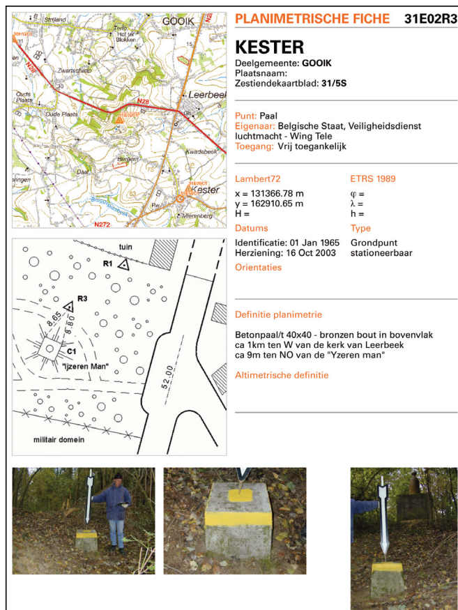
Fiche van het geodetisch punt: de steen hierboven.

De afkorting ICM verwijst allicht naar de maker van deze merktekens.